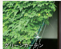
グリーンカーテン