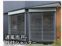
通風雨戸・ 外付シャッター